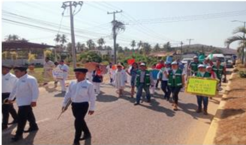
Desfile alusivo a la conmemoración de "Higiene de Manos"