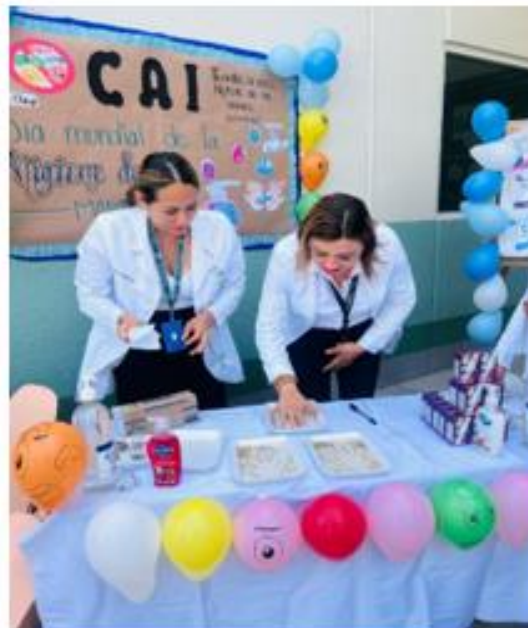
Actividad Lúdica “Manos limpias manos felices”

Los Establecimientos de Atención Médica de las Dependencias del Sector Salud del Estado de Guerrero: ISSSTE, SEDENA, SEMAR, IMSS ORDINARIO E IMSS BIENESTAR, participaron activamente como cada año en conmemoración al 5 de mayo: “Día Mundial de la Higiene de Manos” con diversas actividades de difusión: como son desfiles, capacitaciones, conferencias, simposios, periódicos murales, videos y spots, siendo este año el lema: “Guantes a veces, Higiene de Manos Siempre” , todo ello como una medida para concientizar que la higiene de manos es crucial para prevenir y reducir el riesgo de contraer enfermedades y con ello se evita la transmisión de patógenos a otras personas, especialmente en entornos de atención médica.