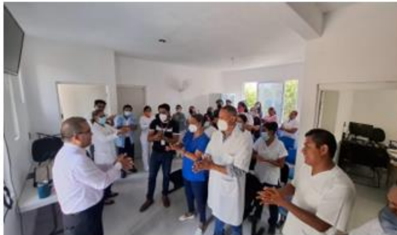
Capacitación a personal de salud, sobre la Técnica de "Higiene de Manos"