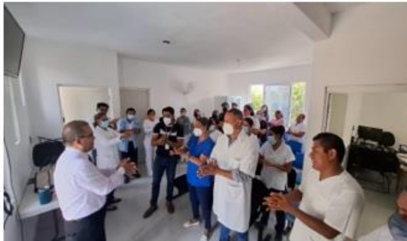
Capacitación a personal de salud, sobre la Técnica de "Higiene de Manos"